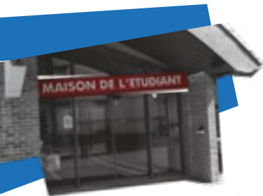
MAISON DE L'ÉTUDIANT Bâtiment M

À Arras, plusieurs espaces vous sont dédiés pour des activités culturelles et associatives.