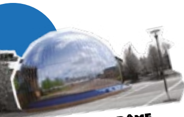
GALERIE DU DÔME Bâtiment K

→ La Ruche , laboratoire culturel de l'université et lieu de rencontres, d'échanges, de spectacles, de projections, d'expérimentations et de créations entre professionnels des arts et amateurs, ouvert sur la cité.