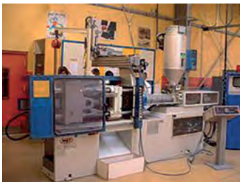
Lycée Fernand Dégrugillier Auchel