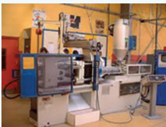
Lycée Fernand Dégrugillier Auchel