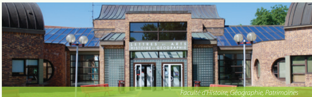
Faculté d'Histoire, Géographie, Patrimoines